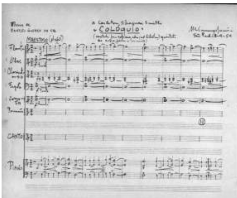
Primeira página manuscrita da partitura Colóquio .

Na estreia, a Orquestra de Câmara da Universidade da Bahia foi dirigida pelo Prof. Hans Koellreutter (Freiburg, 2 de setembro de 1915; São Paulo, 13 de setembro de 2005).